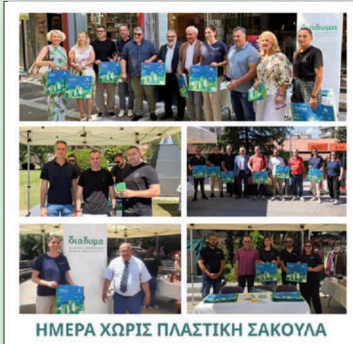
ΗΜΕΡΑ ΧΩΡΙΣ ΠΛΑΣΤΙΚΗ ΣΑΚΟΥΛΑ

Η επαναχρησιμοποίηση αποτελεί βασικό πυλώνα της κυκλικής οικονομίας, καθώς συμβάλλει ουσιαστικά στη μείωση των αποβλήτων, στην εξοικονόμηση φυσικών πόρων και ενέργειας, στον περιορισμό της κατανάλωσης πρώτων υλών και στη μείωση των εκπομπών αερίων του θερμοκηπίου. Μέσα από απλές καθημερινές επιλογές, όλοι μπορούμε να συμβάλουμε στη διαμόρφωση μιας πιο βιώσιμης Δυτικής Μακεδονίας και στη δημιουργία ενός καθαρότερου περιβάλλοντος για τις επόμενες γενιές.